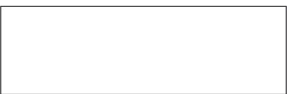
ಹೊಸ ಮಾಲಿಕರ ಸಹಿ